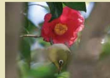
ツバキの蜜を食べにやってきた メジロ