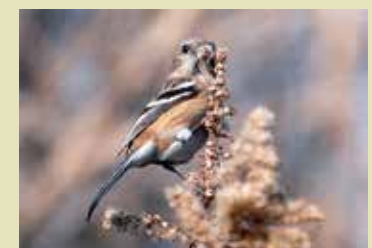
セイトカアワダチソウの種を 食べるベニマシコ