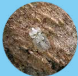
樹皮にかくれる プラタナスグンバイ