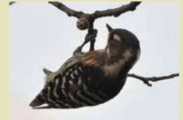
まゆ イラガの繭をつつくコゲラ