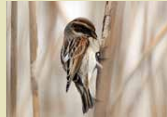
ヨシの茎の中にあるカイガラムシ を食べるオオジュリン

餌が少なくなる冬の間、鳥たちは、どんなものを食べているのでしょうか。 てがたんコースにある食材で、鳥たちのお弁当をつくってみましょう。