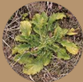
ハルジオンのロゼット